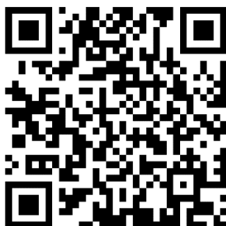
第15屆全球華人化工學者研討會 註冊費支付表